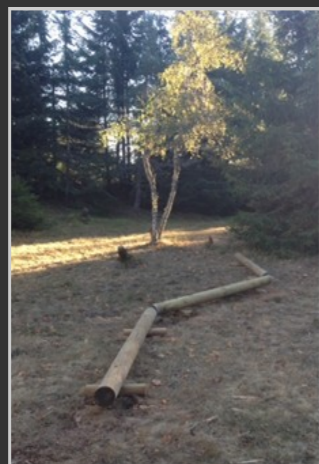
Les ateliers du training Park